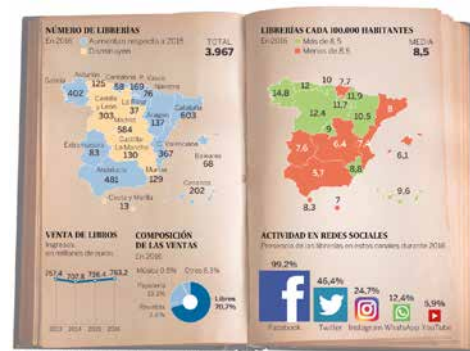
Infografía de Antonio Alonso y Rodrigo Silva / El País

El Observatorio se puede consultar en: www.cegal.es/wp-content/uploads/2017/11/