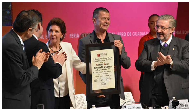
Entrega del Premio FIL de Literatura en Lenguas Romances a Emmanuel Carrère.