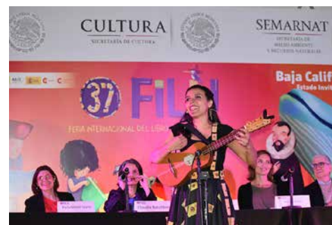
Un gran ambiente se vivió durante la clausura de la 37 FILIJ.

* Con información de la Secretaría de Cultura