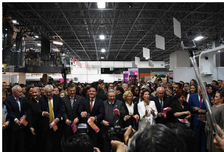
Corte de listón inaugurando la 31 FERIA Internacional del Libro de Guadalajara.

* Con información de la Secretaría de Cultura y FIL Guadalajara